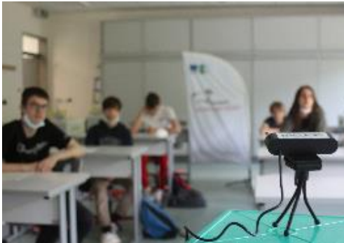
BU: „Kamera läuft!“ Bei der Präsentation der CO 2 -Ampeln durch die neunte Klasse der Oberschule Hanstedt