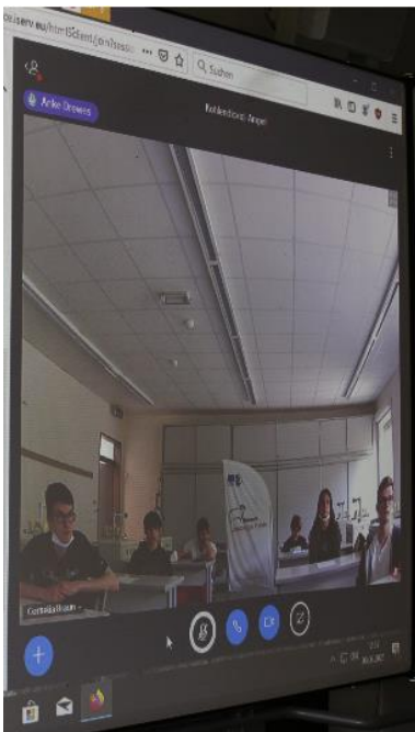
BU: Die Schüler-Präsentation wird live in andere Klassen und ins Lehrerzimmer übertragen