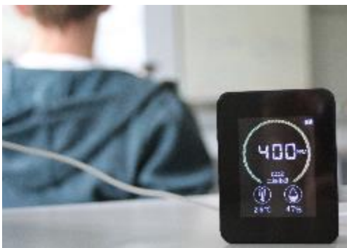
BU: So sehen die 21 Geräte aus, die sowohl den CO 2 -Gehalt der Luft als auch die Raumfeuchte und Temperatur anzeigen